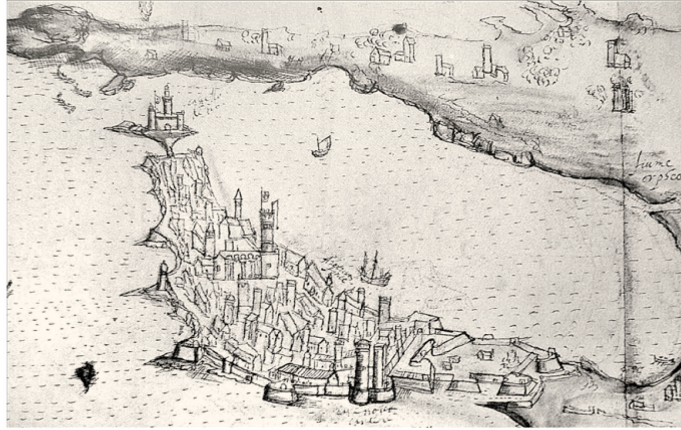
“Saragosa dalla parti di levanti”, Anonimo 1584, Biblioteca Angelica di Roma.

Nel Cinquecento la Peste dilagò a Siracusa per ben tre volte (1500, 1522 e 1575). Ma nel controllo dell'epidemia del 1522 la nuova organizzazione del Prothomedicato, da poco istituita, dovette svolgere un ruolo davvero importante, come si ricava dai dati disponibili