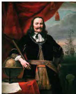
L'ammiraglio De Ruyter (Amsterdam 1607–Siracusa 1676), ferito durante la battaglia navale di Augusta tra Olandesi e Francesi, fu ricoverato all'Ospedale San Giovanni di Dio di Siracusa (allora in piazza Duomo), dove poi morì di setticemia il 29 aprile 1676

Ma il Seicento siracusano va ricordato anche per un curioso evento di interesse ospedaliero, ovvero il ricovero presso l'Ospedale di San Giovanni di Dio di un paziente davvero illustre: il famoso ammiraglio olandese Michiel De Ruyter. In quel tempo era scoppiata una guerra tra Olandesi e Francesi per il controllo della Sicilia, allora ancora in mano agli Spagnoli, alleati degli stessi Olandesi. L'ammiraglio De Ruyter era preceduto dalla fama di autentico "terrore dei mari". Ma nella storica battaglia navale