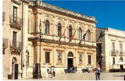
Sovrintendenza Archeologica in piazza Duomo. Sorgeva lì l'Ospedale di San Giovanni di Dio tra il 1591 e il 1869, e prima ancora il S.Maria della Pietà dal 1374