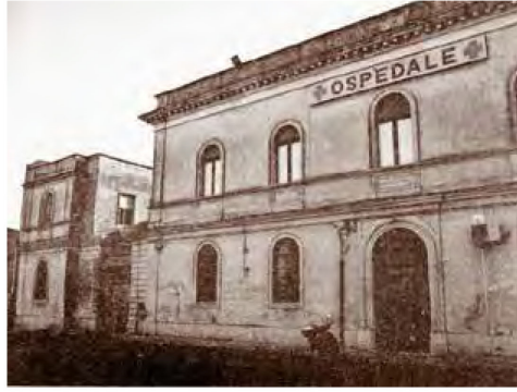
Avola, Ospizio-Ospedale Di Maria, ex Convento Cappuccini