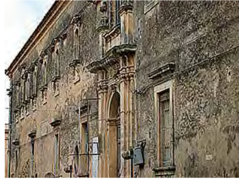
Noto, il vecchio Ospedale Civile Trigona

Agli inizi del Novecento l'ospedale fu ingrandito per ospitare le suore di San Vincenzo, al fine di destinarle all'assistenza degli infermi. Nel 1964 l'Ospedale venne classificato come "Infermeria per malati acuti" e fu dotato di una sezione di Medicina e di una sala operatoria gestita attraverso un chirurgo esterno convenzionato. Quindi nel 1969 l'ospedale fu ulteriormente ingrandito con altre divisioni, fu trasformato in Ente Ospedaliero e venne classificato come Ospedale di Zona. L'attuale Ospedale G. Di Maria, che sorge in contrada Chiusa di Carlo al di fuori dell'abitato, è stato attivato solo dal 1983 (362) .