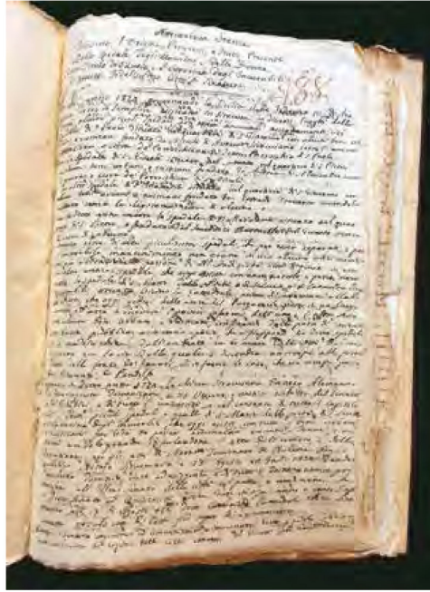
G.M. Capodieci, "Narrazione storica ..." intorno alle origini dell'Ospedale Civico (1789). Manoscritto in "Miscellanea", tomo III, p. 488. Biblioteca Alagoniana

Paolo e di Santa Anastasia nel quartiere di San Giacomo (l'attuale rione dei Bottari di Via Cavour) (381) . Con un atto del 23 agosto del 1374, a firma del notaio Tommaso de Balena, il vescovo Enneco de Alemannia, spagnolo di Saragozza, li riunì in un unico ospedale per uomini detto di Santa Maria della Pietà "prope maiorem syracusanam ecclesiam", retto amministrativamente dal Senato cittadino (382) , che sorgeva nel "piano della Cattedrale". Si può dire che sia stato questo il primo atto costitutivo dell'ospedale di Siracusa. Anche gli Ebrei, intanto, negli stessi anni, avevano istituito un proprio ospedale presso l'attuale Vicolo dell'Olivo (383) . Nel 1555, poi, il Senato cittadino istituì un nuovo ospedale, questa volta riservato alle donne, che prese il nome di Santa Caterina e Santa Lucia . Sorgeva nell'attuale Vicolo Sant'Anna, lungo il