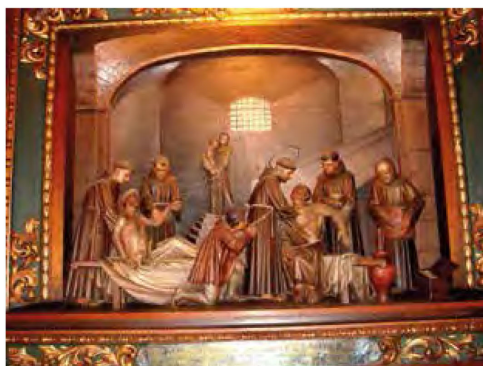
San Francesco cura i lebbrosi (Santuario di Greccio, Rt). I Lebbrosari furono il primo tipo di Ospedalità nel Medioevo

Nella sfera dei valori etici del mondo medievale, l'infermo incarnava l'immagine del Cristo sofferente ed ebbe sempre un posto di grande rilievo, sia nel mondo laico che in quello religioso. Oltre a quella della Chiesa, pertanto, andò diffondendosi paralle-