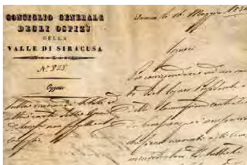
Archivio dell'Ospedale di Lentini. Carteggio tra il Consiglio degli Ospizi e la Commissione di Lentini, 14 maggio 1834

Beneficenza (una per ogni comune della Valle) a sua volta sottomessa al Consiglio Generale degli Ospizi della Valle di Siracusa. L'ospedale fu quindi eretto in Ente Morale con Decreto del 1° ottobre 1867.