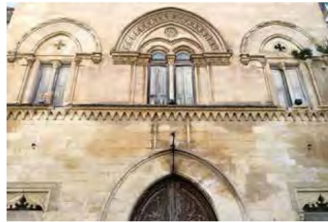
Dopo un breve trasferimento presso il convento delle Teresiane (1869-1876) l'Ospedale cittadino fu allocato al Cinque Piaghe in piazza San Rocco fino al 1953

tragitto da via Roma a piazza San Giuseppe, dove un tempo sorgevano anche le chiese di Santa Maria d'Itria e delle Anime del Purgatorio. Nello stesso anno fu realizzato anche l'Ospedale degli Incurabili intitolato a Santa Lucia (384) . Doveva sorgere al di fuori delle mura cittadine, molto probabilmente, dunque, presso la chiesa di Santa Lucia al Sepolcro. Nel 1564 il Senato dispose che l'Ospedale per donne di Santa Caterina e Santa Lucia dovesse ospitare anche i trovatelli e le nutrici (385) . Nel 1591 i due ospedali, quello di Santa Maria della Pietà per uomini e quello di Santa Caterina e Santa Lucia per donne e trovatelli, furono riunificati in un solo nosocomio presso la chiesa della SS.ma Vergine