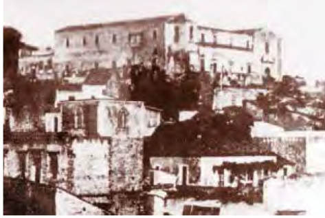
Il Convento-Ospedale di San Francesco in una foto dell' '800