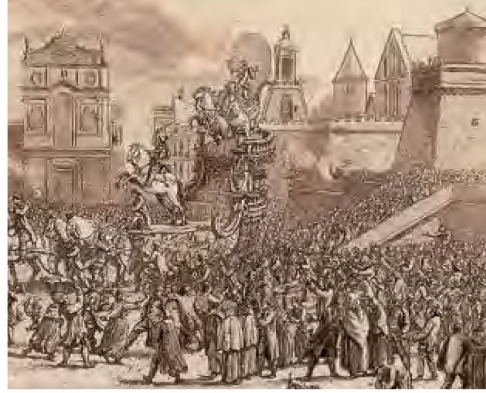
Particolare del dipinto di Houel "Chars ..." (1777). Sulla destra tra le sovrastrutture in cartapesta delle Confraternite si nota il tetto a spiovente dell'Ospedale di San Giovanni di Dio, che sorgeva sul posto del preesistente Ospedale di Santa Maria della Pietà (risalente al 1374), lì dove oggi sorge il palazzo della Sovrintendenza Archeologica in Piazza Duomo

A Siracusa i Fatebenefratelli giunsero appena quattro anni dopo. Quindi nel 1591 il Senato siracusano affidò loro il pietoso compito di assistere gli ammalati presso il preesistente ospedale di Santa Maria della Pietà (348) . Nel 1612 anche l'antico ospedale di San Giacomo della Spada di Lentini venne concesso ai Fatebenefratelli (349) . Il terzo ospedale della provincia affidato