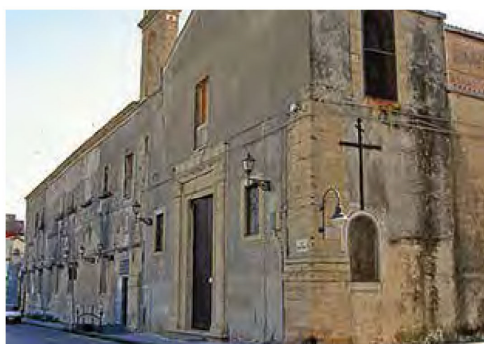
Augusta, l'Ospedale ottocentesco in via Marina di Levante

Il convento, annesso alla seicentesca chiesa-fortezza della Madonna delle Grazie, ospitava all'interno