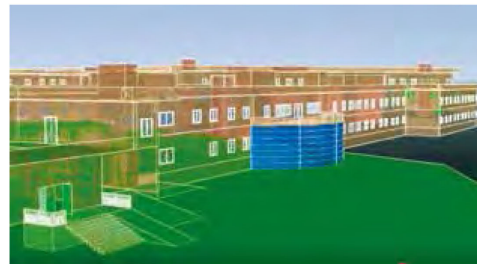
Progetto provvisorio del futuro Ospedale di Siracusa ...

Partendo dall'antico Asklepeion di Ortigia e proseguendo nei secoli attraverso le varie istituzioni ospedaliere medievali e moderne della città, fino a giungere ai nostri giorni e, dunque, fino all'attuale Umberto I, la storia dell'ospedalità siracusana ha coinciso con una estenuante battaglia contro la malattia e la miseria, una autentica lotta per la sopravvivenza, alla continua ricerca delle proprie conquiste di civiltà. E tutto questo fino all'ultima di queste conquiste in ordine cronologico: quella della Radioterapia, così fortemente voluta dall'intera comunità. Ci sia consentito concludere, allora, con una riflessione che è insieme una sfida e un augurio. Quando fu realizzato il primo monoblocco dell'Umberto I nel 1953, si guardò a quella struttura come all'agognata soluzione di tutti i mali. Oggi quella stessa struttura ci appare impietosamente sorpassata dal sopraggiungere delle nuove esigenze, angusta, soffocata, inadeguata, incapace di valorizzare le belle professionalità che vi lavorano ed inadatta a soddisfare le moderne richieste dei cittadini. È per questo che questo excursus che ci ha consentito di gettare uno sguardo nel passato non può che concludersi proiettando lo stesso sguardo nel futuro ed in una nuova sfida che, nel segno di un grande senso civico, deve vedere tutti i siracusani accomunarsi nella ricerca dell'interesse e del bene comune. Una sfida, insomma, che è un augurio. Eccolo ... :