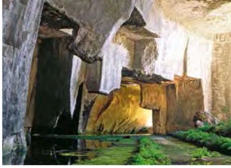
L'Ospedale per gli Incurabili fu una conquista di civiltà. Prima di allora gli appestati veniva trasportati nelle Latomie

Parallelamente a queste, un'altra tipologia di assistenza ospedaliera che venne sviluppandosi in Sicilia fu quella degli Ospedali per pellegrini . Con l'indizione del primo giubileo voluto da papa Bonifacio VIII, nel 1300 gli antichi alberghi-ospedali un tempo dedicati ad accogliere i crociati da e per la Terra Santa furono riutilizzati per accogliere i pellegrini diretti a Roma per la durata massima di tre giorni. In provincia di Siracusa ne venne istituito uno solo, a Lentini, congiunto con quello degli Infermi (339) . Nella prima metà del Settecento, tuttavia, questi tipi di ospedali vennero definitivamente abbandonati e furono sostituiti direttamente dagli alberghi e dalle locande.