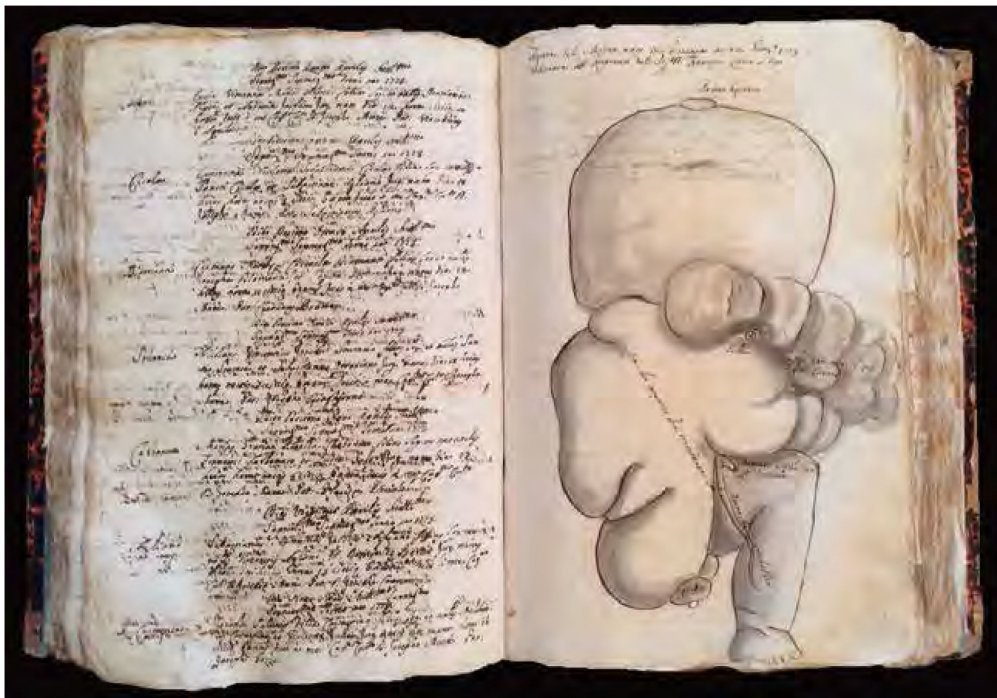
Parrocchia di San Paolo, Ortigia. Liber Baptizatorum ab anno 1753 usque ad annum 1798. Folium 262, Die decimo tertio Junij 1773: “ gemellum natum est monstrum, cuius schema hic apponitur ”. Il parroco del tempo ne fece disegnare le caratteristiche anatomiche

A proposito di “Curiosità mediche” uno degli eventi che turbava maggiormente l’immaginario della gente era la nascita dei cosiddetti “mostri”, che l’ignoranza e le sciocche credenze popolari collegavano agli oscuri segni del Maligno.