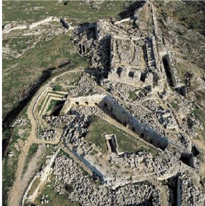
Il Parco delle Mura Dionigiane con il Castello Eurialo visto dall'alto.

oppure anche ‘dall'ampia aia’, nel senso di ‘grande spazio di terreno aperto e spianato’. 4