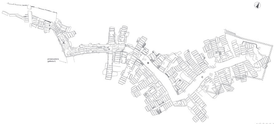
Fig. 1 - Pianta generale