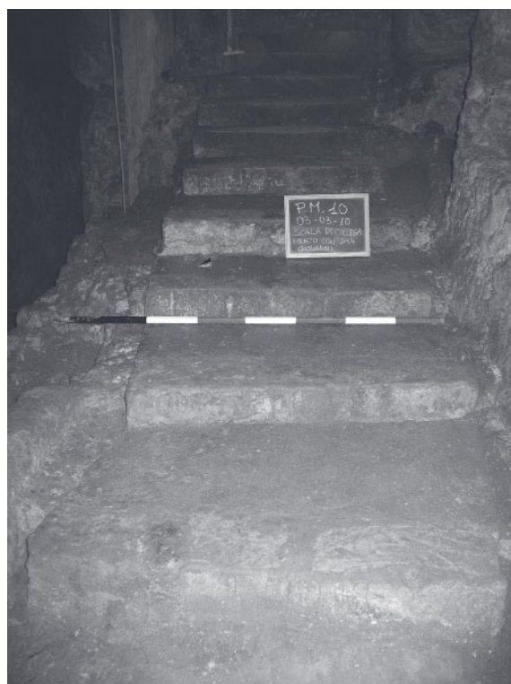
Fig. 4 - Galleria A, settore 4, scala di collegamento tra i cimiteri di S. Giovanni e Predio Maltese (prima della rimozione dei gradini)