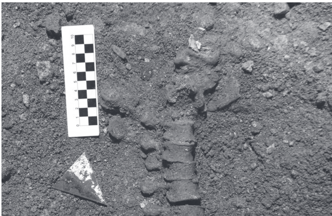
Fig. 3 - Galleria B, settore 2, tomba 17