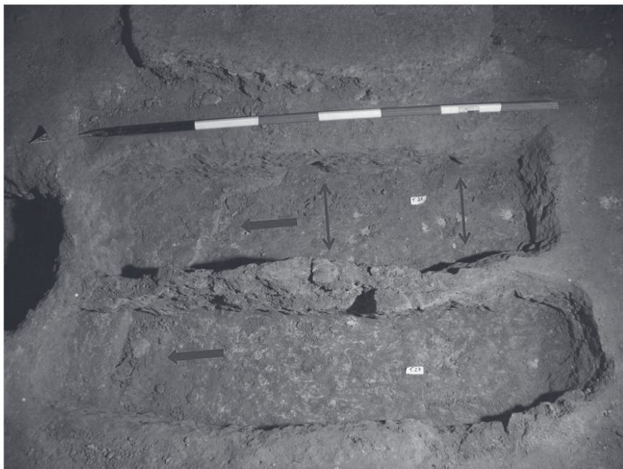
Fig. 6 - Galleria B, tombe 22-23, letti di deposizione con cuscini orientati a Nord-Ovest e, nella t. 22, fori per l'alloggiamento di letto ligneo