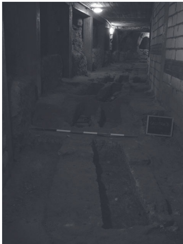
Fig. 2 - Galleria B, veduta generale