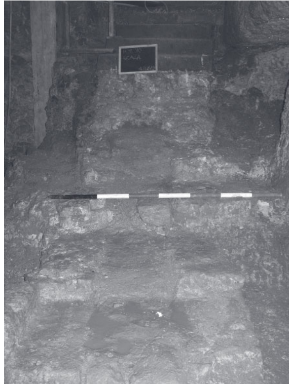
Fig. 5 - Galleria A, settore 4, scala di collegamento tra i cimiteri di S. Giovanni e Predio Maltese (dopo la rimozione dei gradini)