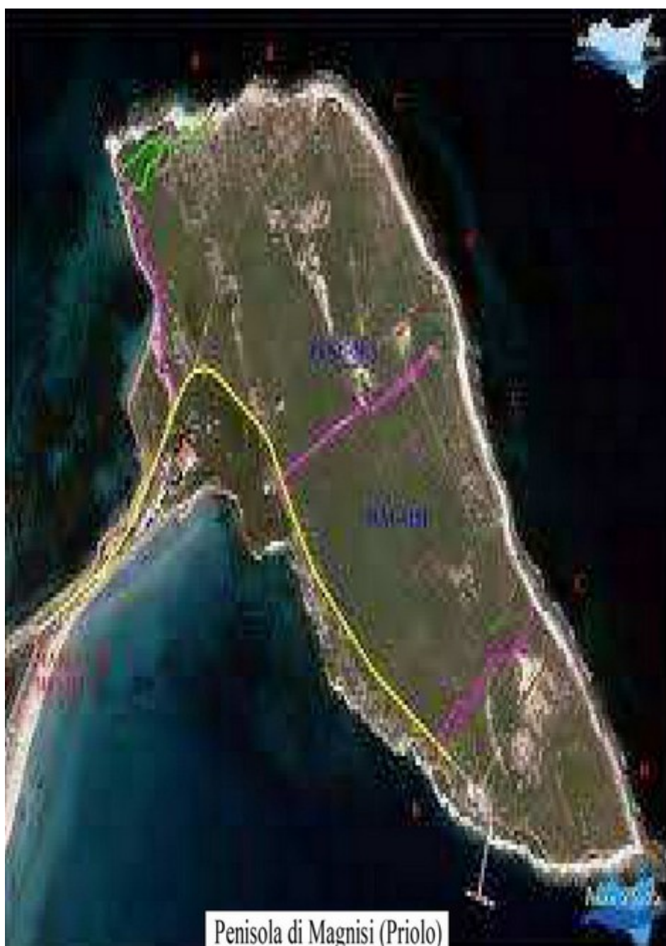
Penisola di Magnisi (Priolo)