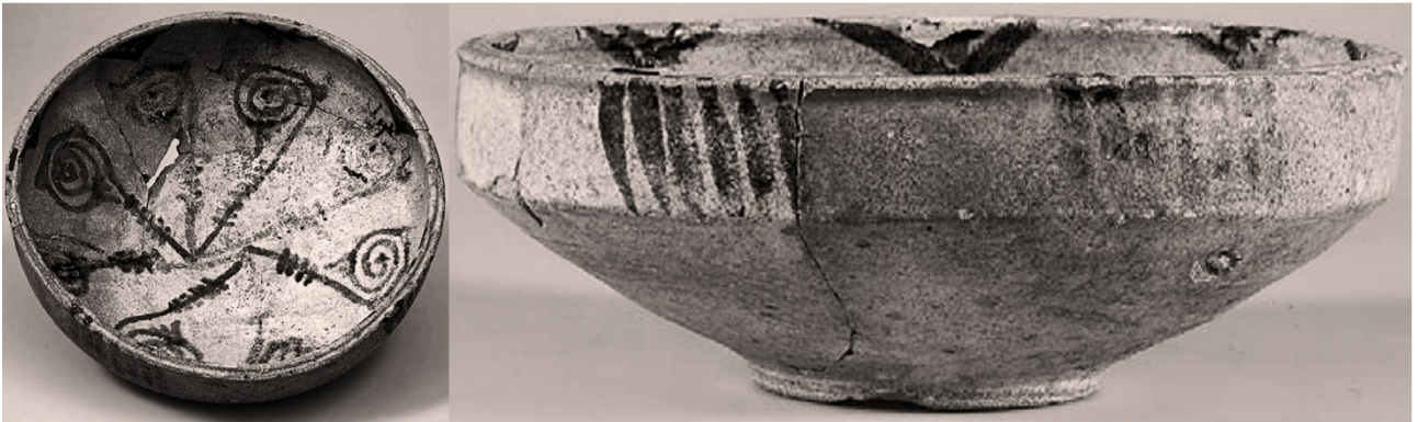
4. - Corte dei Bottai; catino invetriato (XI secolo).