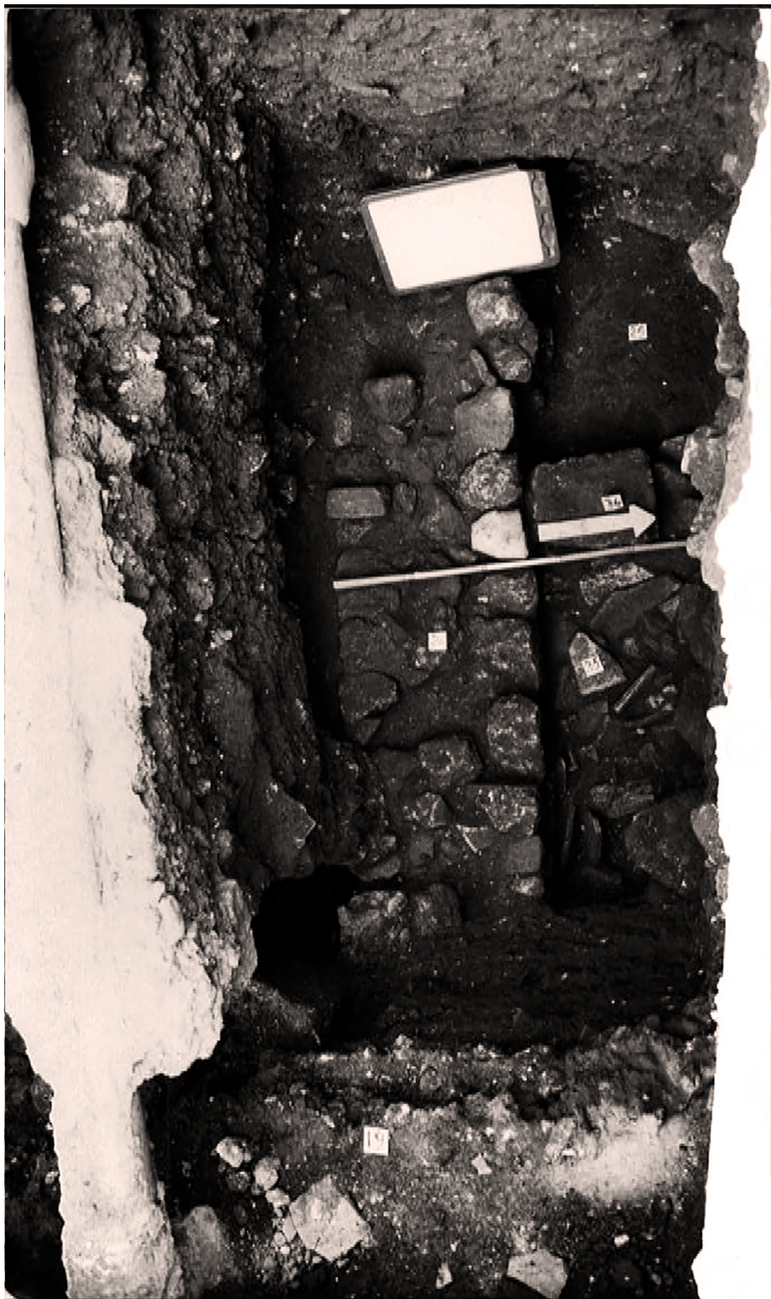
3. - Arcivescovado, saggio B.