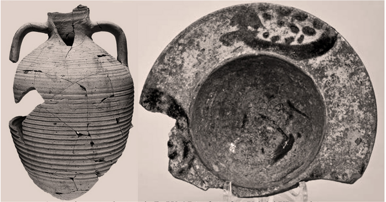
4. - Arcivescovado, saggio B, US 37; anfora (fine X-inizi XI secolo).