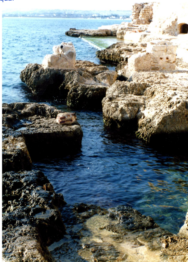
Fig. 35 - Altri resti di strane escavazioni fatte nella viva roccia, come questa qui, che oggi risulta parecchio sotto il livello del mare. Attualmente questi manufatti risultano di difficilissima interpretazione.