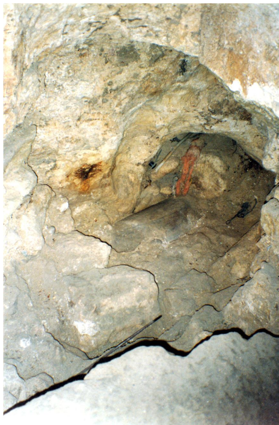
Fig. 29 - Lo stesso scasso ha rivelato (qui a destra) un rincasso cui è stata data la forma di arco, liscio e piuttosto accuratamente scalpellato nella viva roccia. Per quanto occluso, anche il vano sottostante mostra "gli stipiti", se così li possiamo chiamare, arrotondati. Sovrapposto ad un fusto di colonna marmorea se ne intravede un ulteriore pezzo più corto, appartenente ad un'altra, anche questo posato nella stessa direzione.

Sul fondo del tanto deprecato scasso della muratura sotto il pianerottolo, abbiamo potuto fare un'ulteriore osservazione: proseguendo nella direzione della roccia "levigata", in quella parte della massa muraria che era realizzata con calcestruzzo, si vede annegata una colonna di marmo cipollino che risulta messa in opera orizzontalmente - quasi bisettrice del diedro che la roccia forma con la massa del muro N-O (Fig. 29).