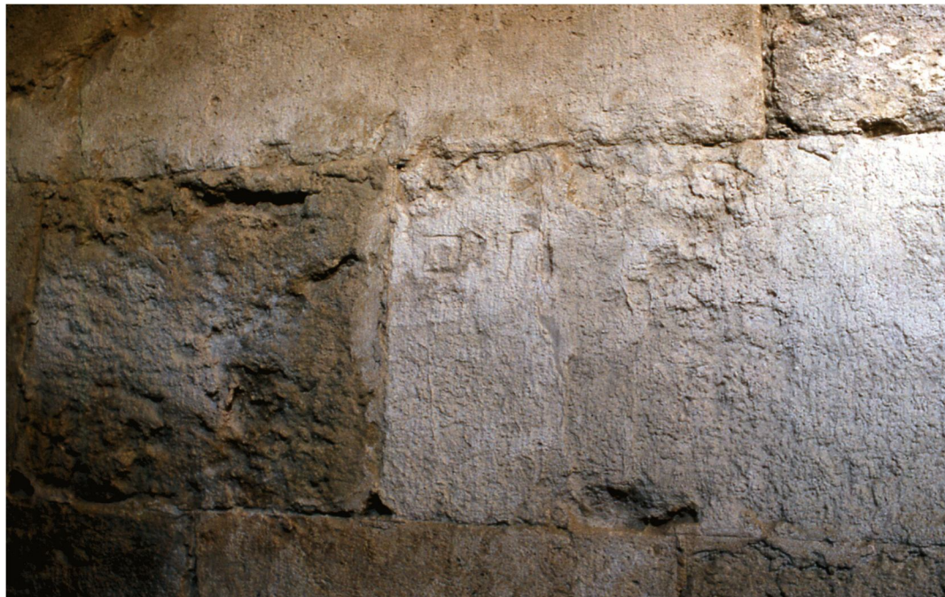
Fig. 31 - L'accurata ricerca dei marchi dei lapicidi incisi sui conci delle del Castello ci ha fatto scoprire, sulla parete destra della rampa più lunga, un concio recante questi inaspettati segni.