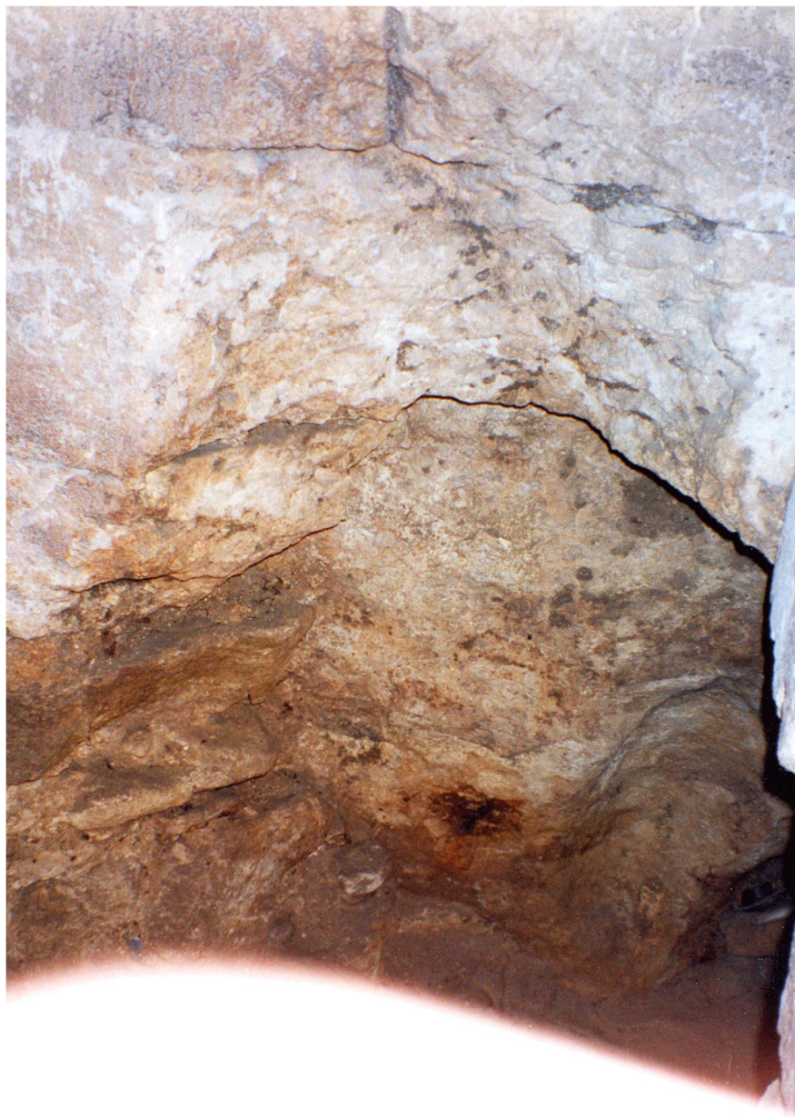
Fig. 28 - Lo scasso delle murature ha rivelato (qui a sinistra) che la muratura sveva del vano scala era stata semplicemente addossata alla superficie di una retrostante preesistente parete verticale, ricavata dalla roccia viva: quasi a foderarla.

Si può fare un'importante constatazione semplicemente controllando il vano che contiene la scala. Nel tratto che sta proprio sopra il menzionato pianerottolo inferiore (che è anche l'unico tratto della scala in cui si può effettuare questo tipo di controllo), la parete del vano-scala verso il lato esterno del Castello, fa palesemente parte di una muratura che è stata soltanto addossata alla retrostante roccia viva verticale: sembra messa in opera quasi a foderarla (Fig. 28).