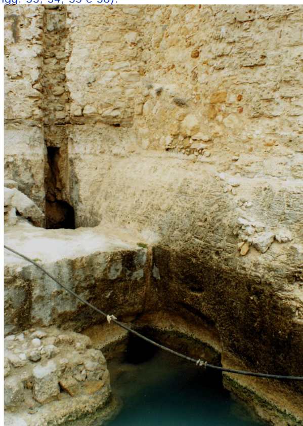
Fig. 33 - Lo sbocco dell'acqua proveniente dalla fonte del cosiddetto Bagno della Regina si trova ad una ventina di metri all'esterno del Castello. Anche se non ci è stato dato di poter esplorare il suo percorso, oggi occultato dalle opere militari del Quattrocento e del Cinquecento, qui ne vediamo la fuoriuscita, ma – sorprendentemente – dentro un ampio ambiente, a sua volta collegato con mare aperto, ed il tutto ricavato con cura nel banco delle viva roccia.

Parlando dell'area attorno al Castello Maniace, i numerosi resti di vasche e di altri manufatti scavati nella roccia e dei quali abbiamo scritto sopra, risultano oggi visibili tutti soltanto lungo l'orlo del banco di roccia prospiciente il mare (alcune si vedono addirittura semisommerse), cioè in quello spazio di risulta che nel progresso del tempo non venne occupato dal continuo accrescersi del numero delle costruzioni militari: si vedono, cioè, tutte a corona attorno alla base delle varie parti del Castello (Figg. 33, 34, 35 e 36).