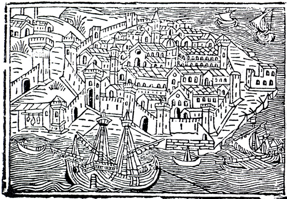
Siracusa con la sua cinta e le sue torri in una pianta del 1535. (Dufour - 1987)

L'iscrizione, scoperta recentemente dal prof. Zorić, giace su un rigo lungo cm. 13,5 (Fig. 37).