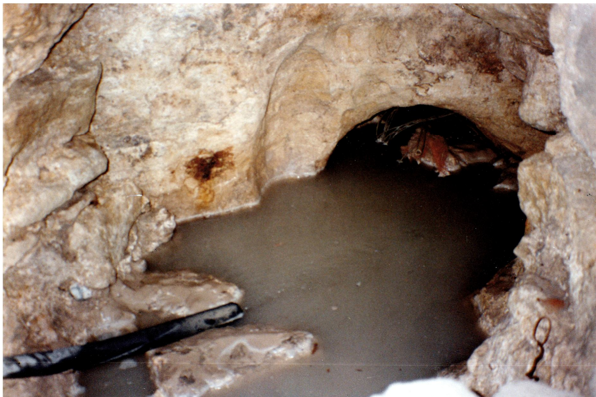
Fig. 30 - Lo stesso soggetto, con la cavità parzialmente riempita di acqua; nella vista ravvicinata, notiamo che non soltanto l'arco, ma anche la roccia circostante non sono scabri, ma piuttosto lisci (a destra e a sinistra si scorgono le murature "costruite").

In quanto a noi, dopo aver lavato la roccia ed aver così tolto lo sporco ed il sedime che celava alla vista le sue reali forme, proprio sopra il varco occluso con l'uso delle colonne menzionate, abbiamo notato, infatti, un rincasso a forma di arco, piuttosto accuratamente scalpellato nella viva roccia. Per quanto compagnato, anche il vano sottostante mostra "gli stipiti", se così li possiamo chiamare, arrotondati (cfr. Figg. 29 e 30).