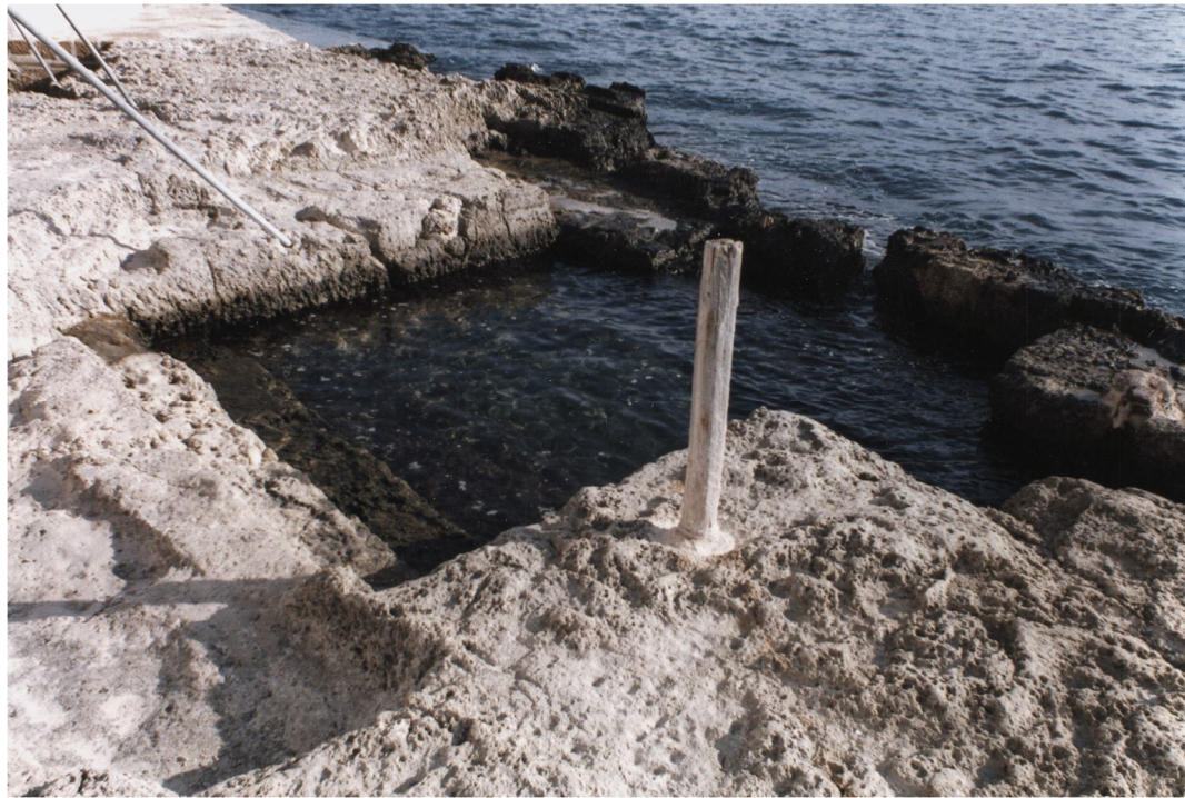
Fig. 34 - Nel banco roccioso su cui sorge il complesso di Castel Maniace si vedono un pò dappertutto resti delle escavazioni fatte nella viva roccia; qui è una addirittura con i gradini che scendono in acqua.