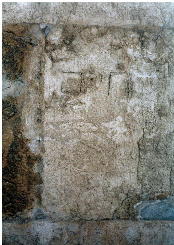
Fig. 32 - I segni incisi sono una breve scritta in caratteri ebraici, letta e traslitterata è HAYYM.