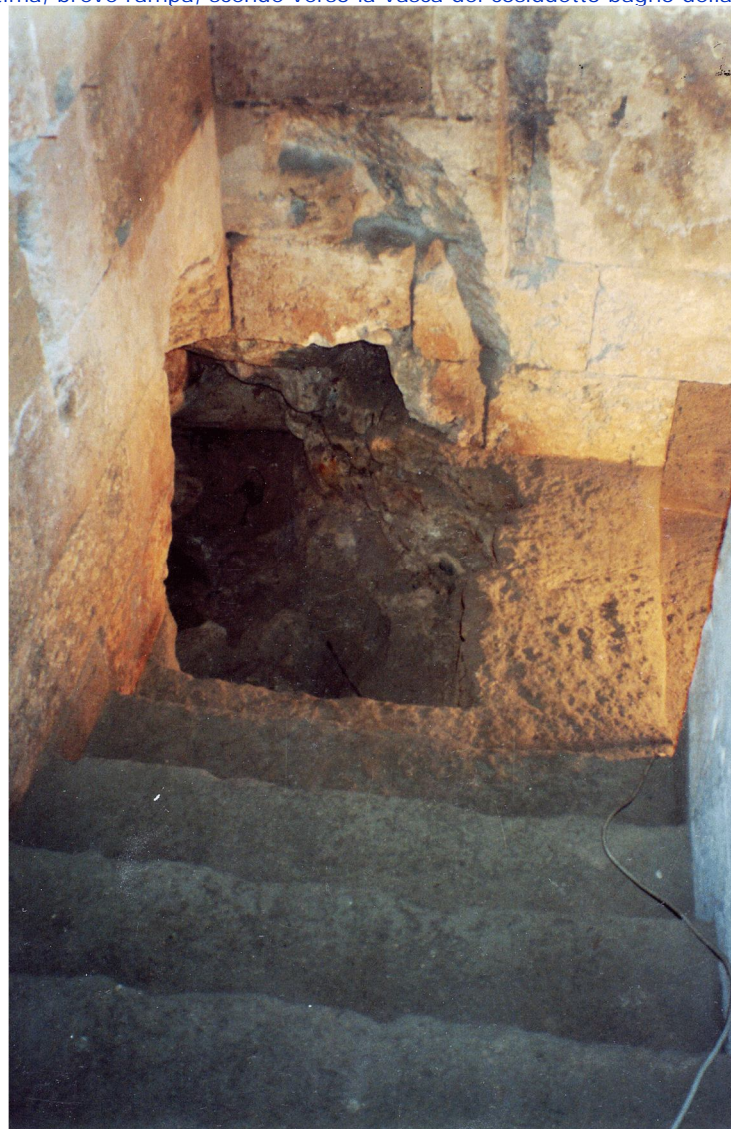
Fig. 27 - Il pianerottolo inferiore; a destra la rampa che scende al cosiddetto Bagno della Regina. A sinistra si vede lo scasso in breccia operato nel pavimento e nel diedro delle soprastanti murature.

Nei tempi relativamente recenti qualche sciagurato personaggio (per noi rimasto comunque sconosciuto, come sconosciuti rimasero i suoi fini) aveva effettuato uno scasso in breccia, ed anche di notevole entità, nella massa muraria del triedro formato dai due muri concorrenti nell'angolo occidentale e dal sottostante pianerottolo dal quale l'ultima, breve rampa, scende verso la vasca del cosiddetto bagno della Regina (Fig. 27).